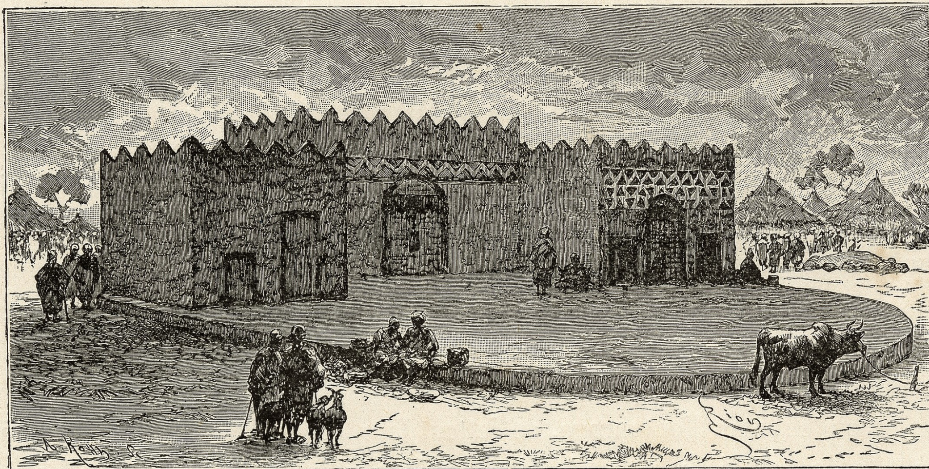
Résidence de Waghadougou.