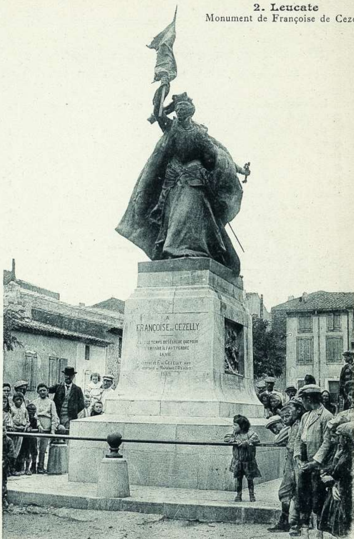
Statue de Françoise de Cézelly à Leucate, carte postale du début du XXIème siècle côté F°6/371