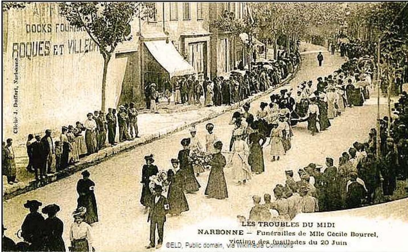
Funérailles de Cécile Bourrel à Narbonne , Archives municipales de Narbonne © ELD, PUBLIC DOMAIN, VIA WIKIMEDIA COMMONS