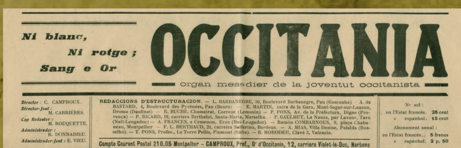
Titol del periodoc Occitania, organ mesadier de la joventut occitanista, n° 22, 7 decembre de 1935