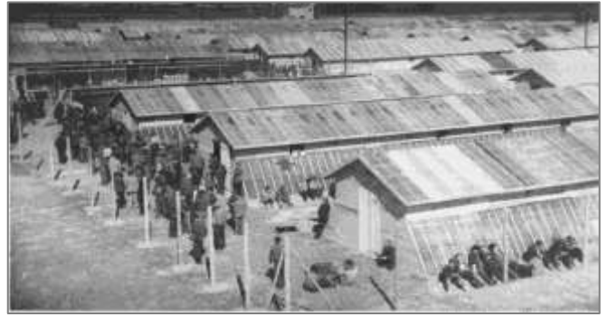
©AD11_2FI00818_076 / Camp d'accueil des réfugiés espagnols du Pigné, sur la commune de Montréal, dit camp de Bram.- Construction et aménagements. (février-mai 1939)

DIARI D'UN FOTOGRAF : BRAM, 1939 / Agusti Centelles ; éd. par Teresa Ferré. - Barcelone : Destino, 2009. - 200 p. - (L'Anora). Texte en catalan. [D°4335]